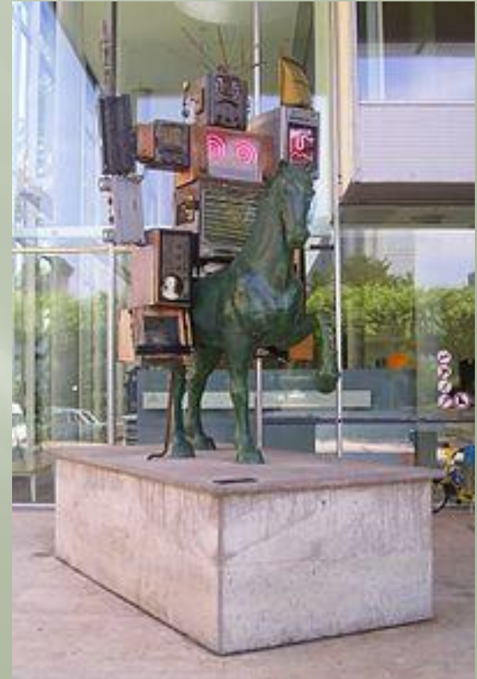
Pre-Bell-Man, posąg przed 'Museum für Kommunikation', Frankfurt nad Menem, Niemcy