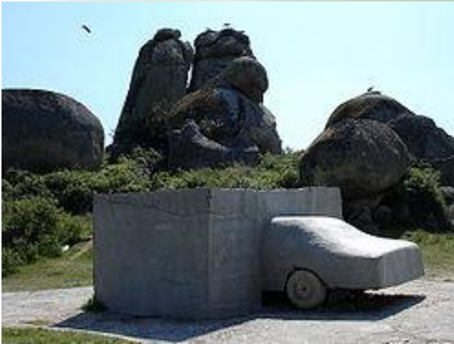
VOAEX, 1976, Muzeum Vostell Malpartida

Oto kilka innych przykładów dzieł Nurtu konceptualizmu.