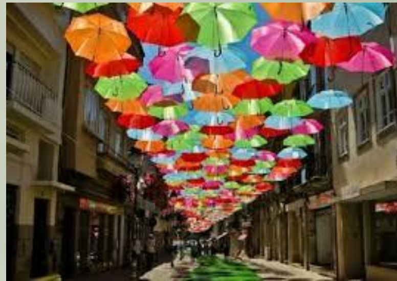
"Umbrella Sky" na ulicach miasteczka Agueda.