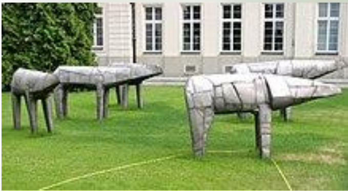
M. Abakanowicz, Mutanty na dziedzińcu pałacu Potockich w Warszawie