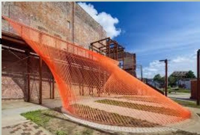
Pomarańczowa instalacja z siatki skwer w Coshocton, Ohio