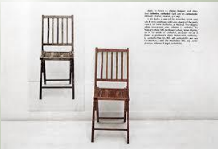
Joseph Kosuth, Jedno i trzy krzesła , 1965r.