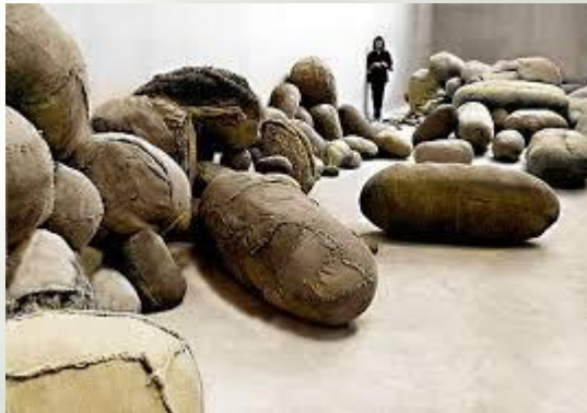
Embriologia , M. Abakanowicz, 1980